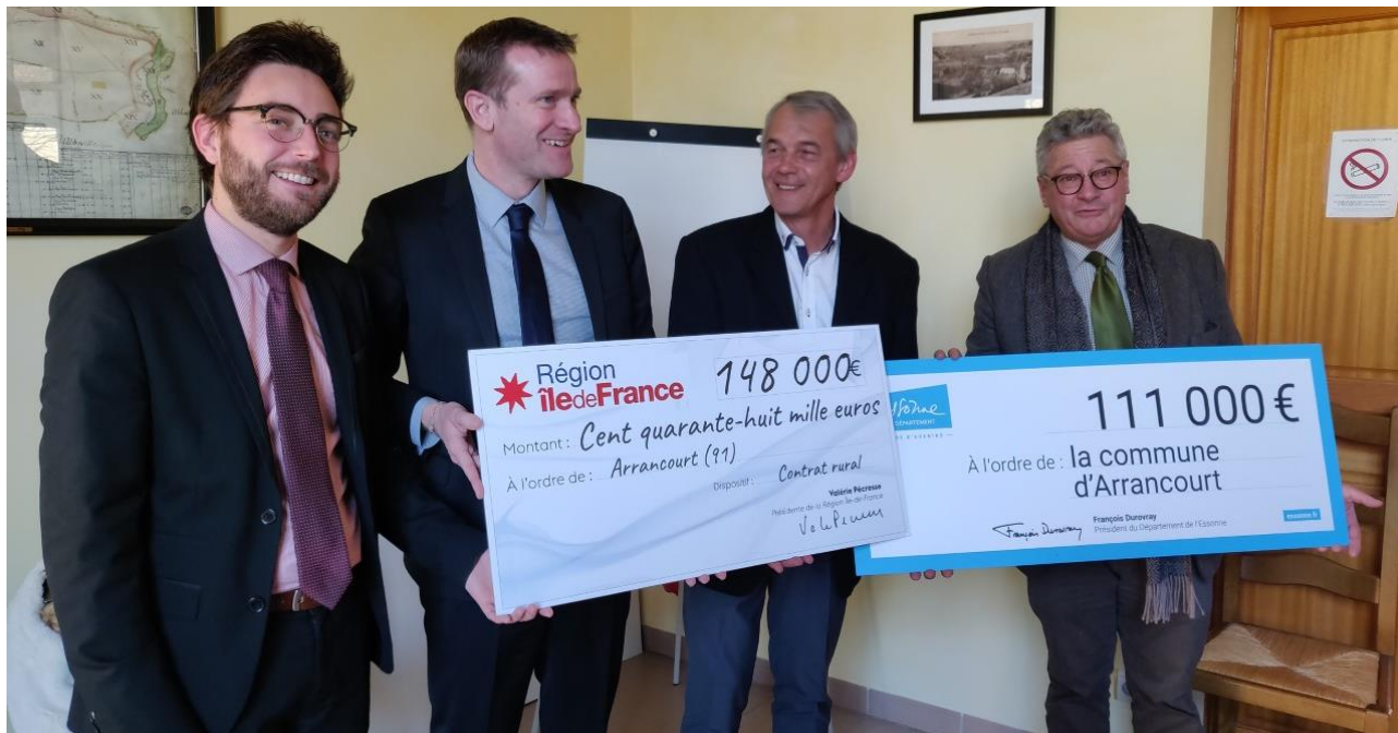
Signature du contrat rural